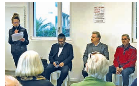
Rencontre interreligieuse pour la Paix.