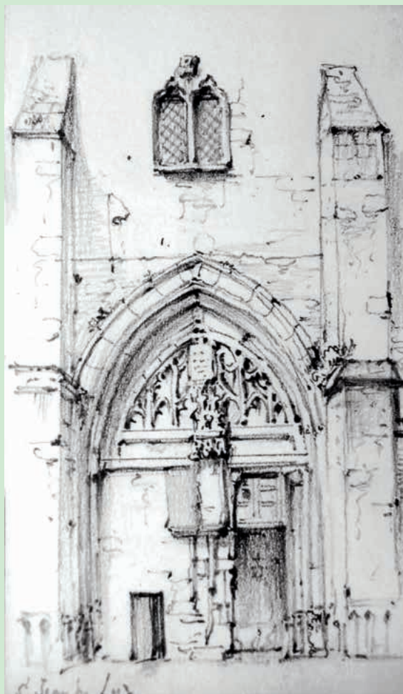
La porte d'entrée de l'église de Saint-Jean-de-Luz, avant sa rénovation, où l'on voit la porte des cagots ; extrait d'un dessin vers 1850.

Les discriminations cessèrent peu à peu... L'exclusion sociale dont les cagots furent victimes ne constitue pas uniquement un fait historique. Elle est une interrogation sur notre société présente. Saurons-nous ouvrir grandes les portes, sans discrimination, à nos frères et sœurs en humanité ? [Jacques Ospital]