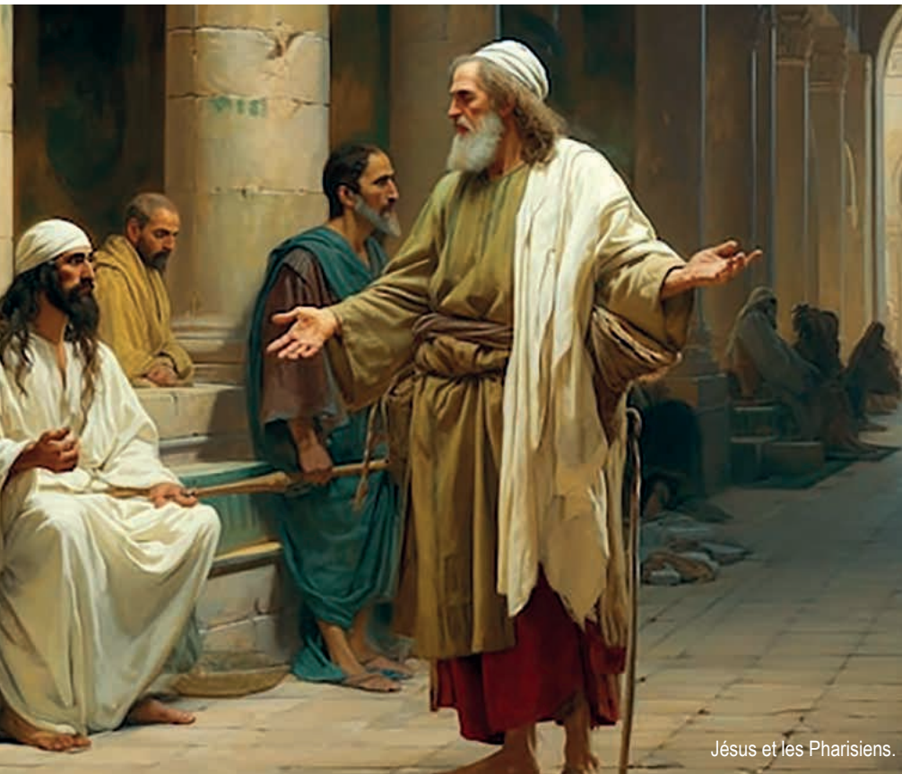
Jésus et les Pharisiens.